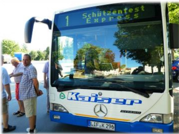
Sicher hin und zurück - im Schützenfest Express