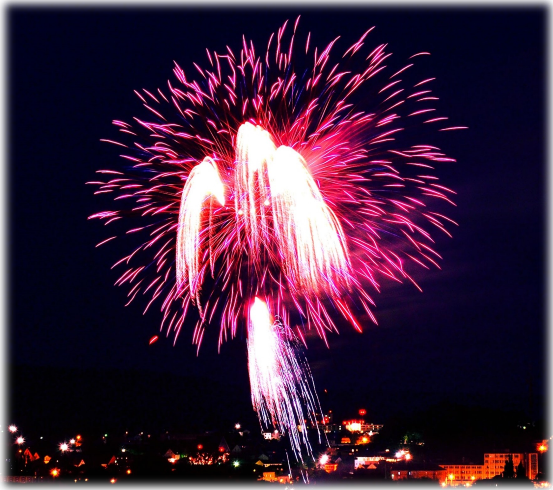
Titelbild: mit freundlicher Genehmigung von Peter Müller / Lichtenfelser Foto Club „Bild des Monats Oktober 2018“ - Titel „Rise of the Purple Angel“ aufgenommen am Schützenfest Feuerwerk 2018