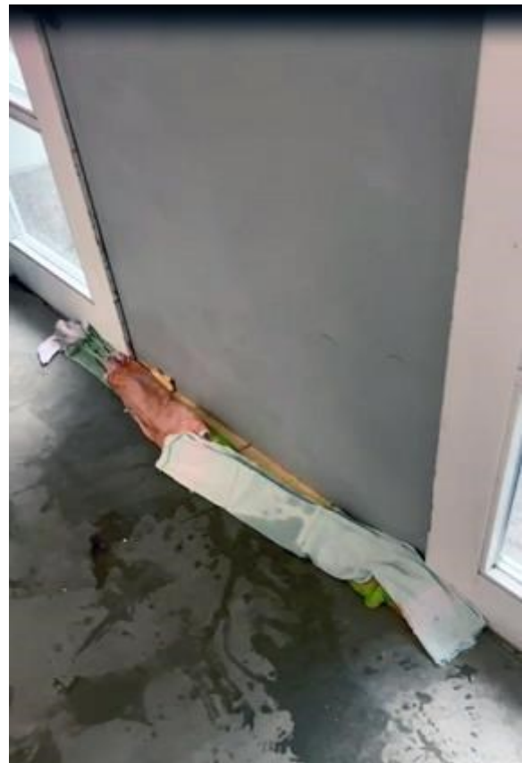
Vom Schützenplatz suchte sich das Wasser seinen Weg in unsere Schießanlage