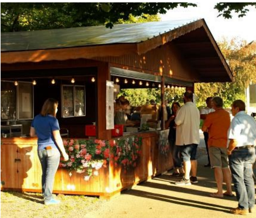
Die anwesenden Schausteller boten wieder ein vielfältiges Speisenangebot und das Kinderkarussell zog viele junge Familien auf den Schützenplatz.