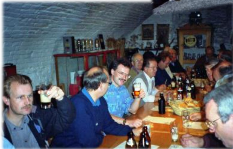
1993 Bierseminar im Allgäu