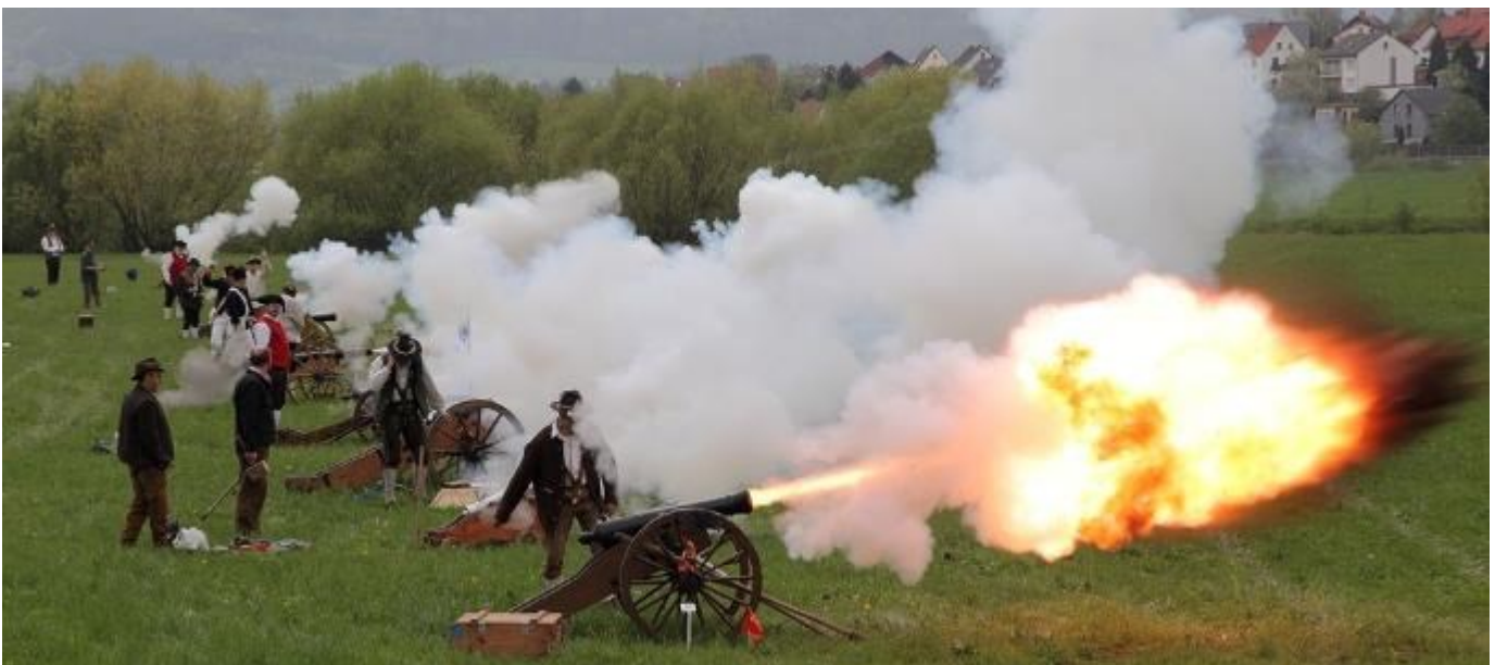
Foto: Zu den spektakulären Aufnahmen des Rückblicks auf das Jubiläumsjahr der Lichtenfelser Schützen gehörte auch dieses Bild von Siegfried Mischke, das beim 2. Oberfränkischen Bezirksböllertreffen aufgenommen wurde.

Ein lang anhaltender Applaus und ein Dank des Schützenmeisters Erwin Kalb galt allen die mit ihrem ehrenamtlichen Einsatz dazu beigetragen hatten ein großes Jahr der Lichtenfelser Schützen in Wort und Bild festzuhalten.